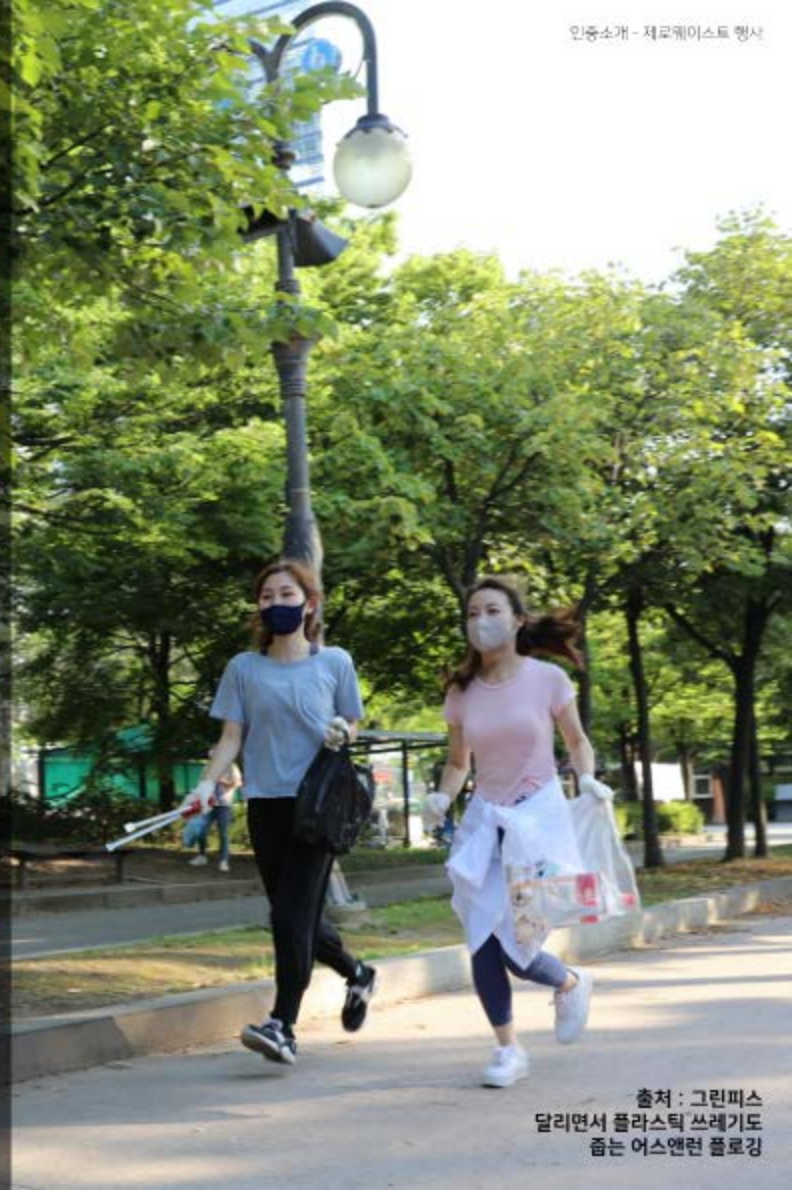
달리면서 플라스틱 쓰레기도 줍는 어스앤러 플로깅