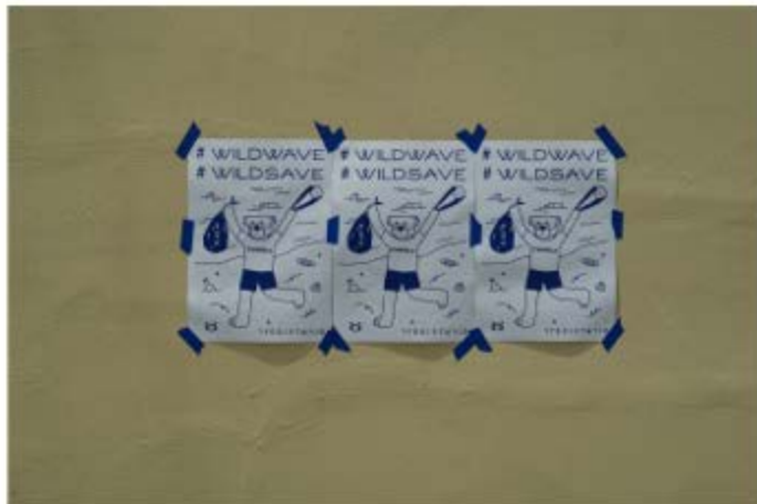
플로깅 캠페인 포스터 (21년 환경의날)

플로깅(plogging)은 '이삭 등을)줍다'라는 의미의 스웨덴어 '플로카 우프'(plocka upp)와 영어 '조깅'(jogging)의 합성어