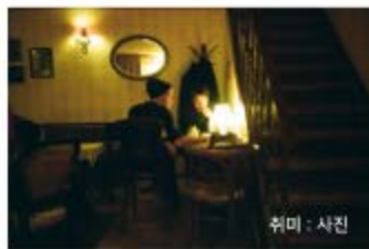
취미 : 사진