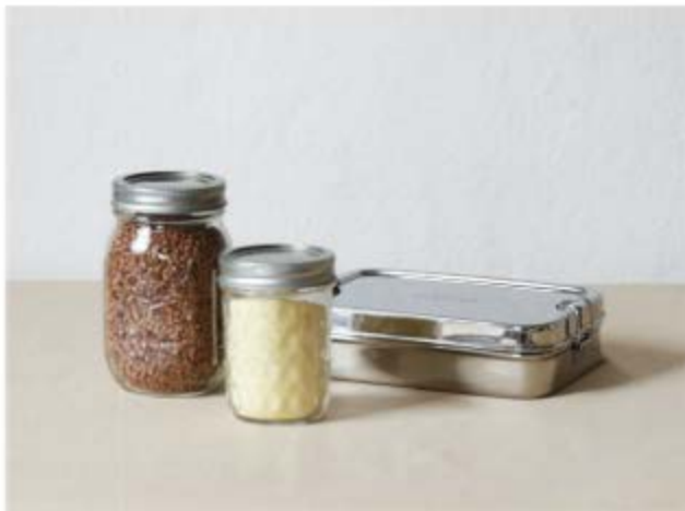
다회용 용기 사용하기