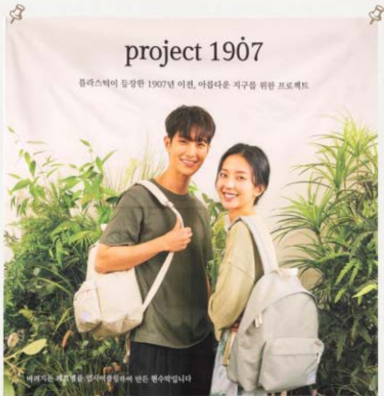
비리지는 폐기물을 없애어 환경하여 만든 현수막입니다