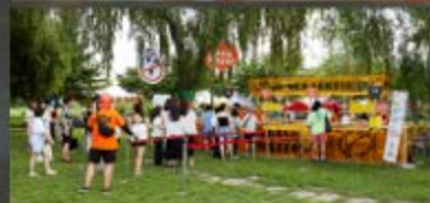
트레쉬버스터즈 다회용기사용 및 행사사진