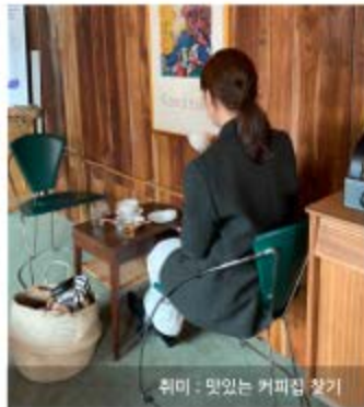
취미 : 맛있는 커피집 찾기